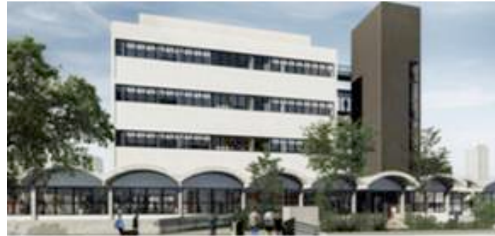
CENTRO CULTURAL DA SAÚDE UNIFESP (PROJETO DE MODERNIZAÇÃO DA BIBLIOTECA DO CAMPUS SÃO PAULO)